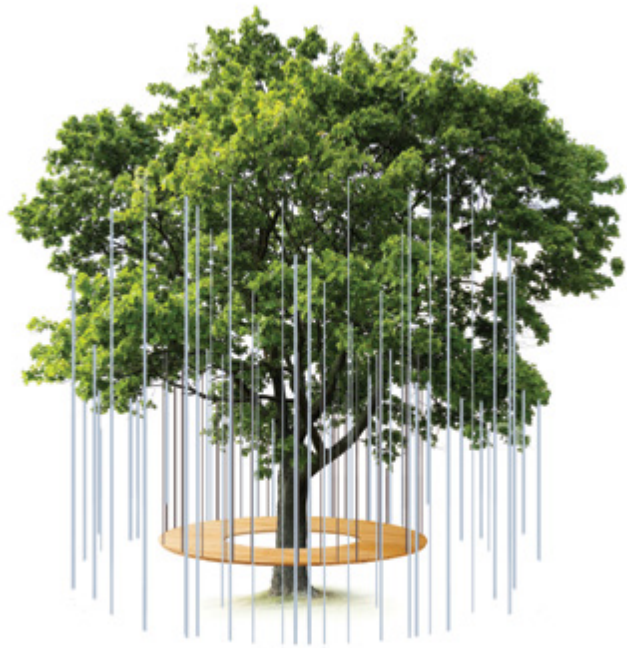
Laurent Gongora, ÉLÉMENTAL , Durmenach

L'idée de réconciliation entre l'Homme et les éléments naturels sous-tend ce dispositif qui s'inspire de la fontaine pour ses aspects poétique et symbolique. Jadis la fontaine avait une place centrale dans les villages, d'abord pour l'approvisionnement en eau, puis en tant que lieu d'agrément en invitant les habitants à la pause. L'œuvre invite à un tel ressourcement.